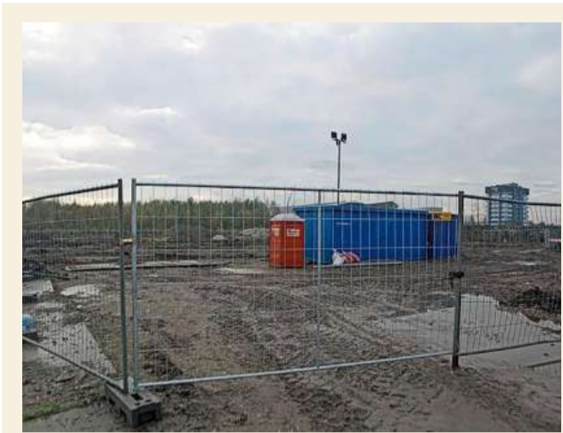
De bouw van het theater laat op zich wachten.