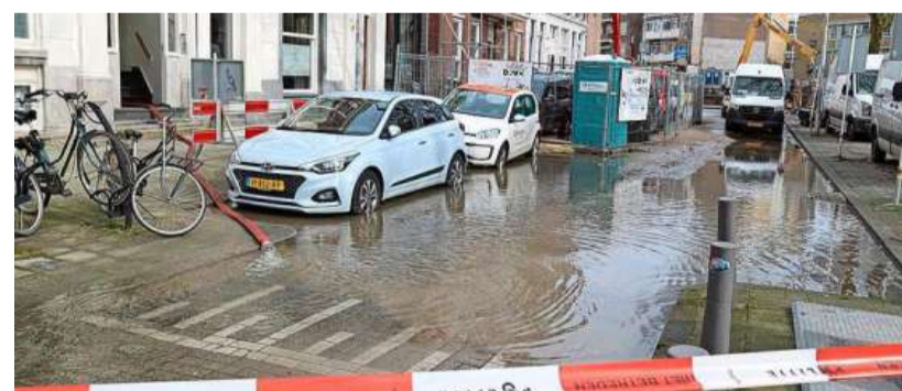
Een waterballet in de Schiedamsesingel.

meenteraad voor. „We hadden de ME als verzekeringspremie nodig. Omdat ze de bus niet aan konden vallen zijn ze gaan knokken met de ME. Dat is bizar, wat speelt er door hun hoofd? Dit gaat niet om een paar mensen, duizenden krijg je niet zomaar in de tang.” Zonder uitpubliek waren bij de vorige editie vierhonderd agenten nodig en de kosten zijn 'dramatisch'. Toch is het geen verbod van alleen de burgemeester, stelde Aboutaleb. „Ik wil het gesprek over een experiment aangaan, met welwillende supporters en clubs.”