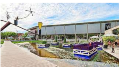
Zo moet het eruit komen te zien. ILLUSTRATIE HNI

De fractie heeft vragen gesteld en wil van het college de redenen weten waarom bouw van het theater nog steeds niet is gestart, terwijl de gemeente afgelopen december meldde dat er na de kerst zou worden begonnen. Ook vraagt de partij zich af wat er gebeurt met het beschikbaar gestelde bouwdepot met 630.000 euro. „Wat ons betreft krijgen we dat terug.” Het bedrijf achter de musical 'Willem van Oranje' wilde donderdag niet reageren op vragen. „We komen eind deze maand met meer informatie naar buiten”, aldus een woordvoerder.